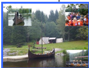
Ankret opp i Mønevannsfjorden