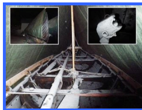
Frosten kom før snøen!