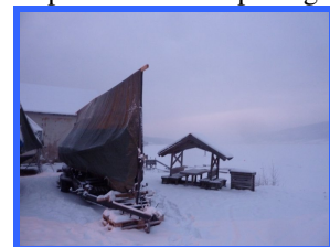
Skipet er vinterlagret på berget