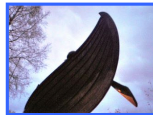
Skipet er klar for høstvask