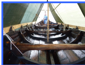
Vårpuss ferdig innvendig