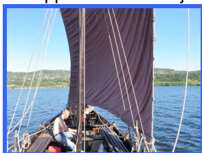
Seiling på Mjøsa